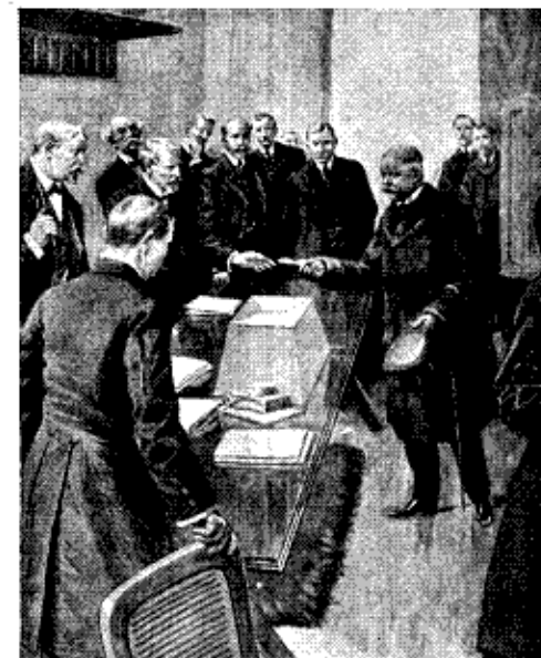
RIGSKANSLER BÜLOW AFGIVER SIN STEMME VED VALGENE.

Den tyske Rigsdag opløstes paa Spørgsmaalet om Bevillingen til Krigen i Sydafrika. Den uheldige tyske Kolonialpolitik med sin militære Administration har indenfor Befolkningen mødt mægtig Modstand, men Valget, der blev stillet op som afgørende for den nationale Ære, vakte det tyske Folks Stolthed, og vil sikkert vise sig som en afgjort Sejr for Regeringen og Kejsersens Kolonialpolitik.