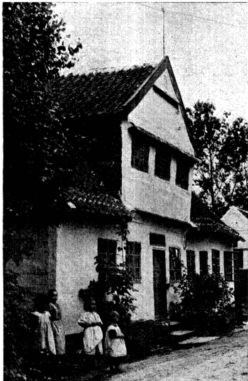
KILDEHUSET VED ROSKILDE