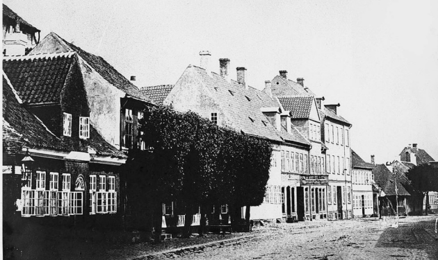
Foto: Ukendt fotograf. Før 1875. Affotograferet af Kristian Hude. Roskilde lokalhistoriske Arkiv.

Men denne æra fik også en ende efter besættelsestiden. I dag er navnet Trægården benævnelse på en karrébygelse med 60 andelslejligheder bygget på grunden i 1953.