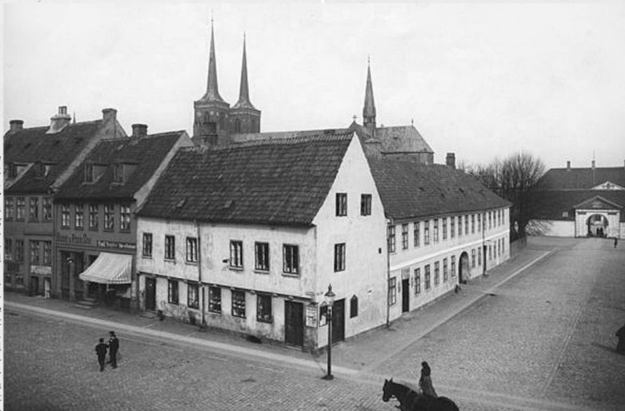
Torvegården på hjørnet af Raadhustorvet og Nytorv.

Før 1875.