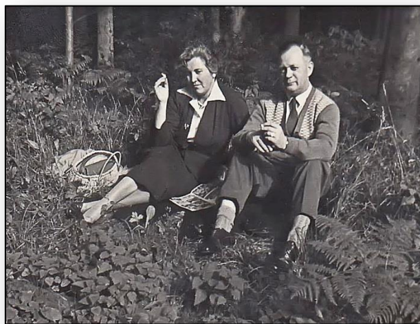
Far og mor i Boserup Skov - et billede fra 1959 – og selvfølgelig havde man sit pæne tøj og slips på !

Søndag var ellers den dag, hvor vi fik søndagstøj på – kridtede gummiskoene med kridt på en tandbørste – og gik tur i byen eller Folkeparken. Vi kunne også pakke badetøj og madkurv og cykle til Boserup skov eller Vigen.