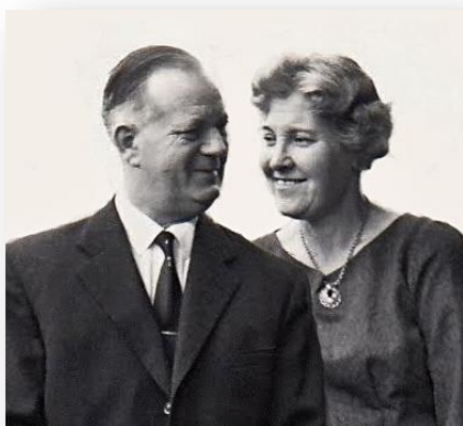
Mine forældre i 1964 – efter at de havde sagt farvel til købmandsforretningen

Mine forældre havde forretningen til 8/12-62. Min far startede derefter på kontoret på Risø d. 15.1 1963.