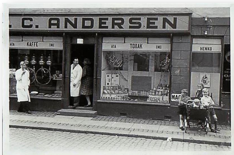
Far ses her i døren til forretningen engang sidst i 1940'erne

Der var nok ikke mange kunder kl. 7, men der var arbejde der skulle gøres. Han fejede altid fortov, og det halve af vejbanen for det skulle man, sagde han. Det havde man pligt til. Budcyklerne, en "Long John" og en anden cykel blev pumpet, og tomme ølkasser blev slæbt om i baggården, hvor de på et tidspunkt blev afhentet og skiftet ud med fyldte kasser. Der skulle sættes varer på hylderne, og skuffer med mel blev tjekket for at være helt sikker på, at der ikke var smådyr.