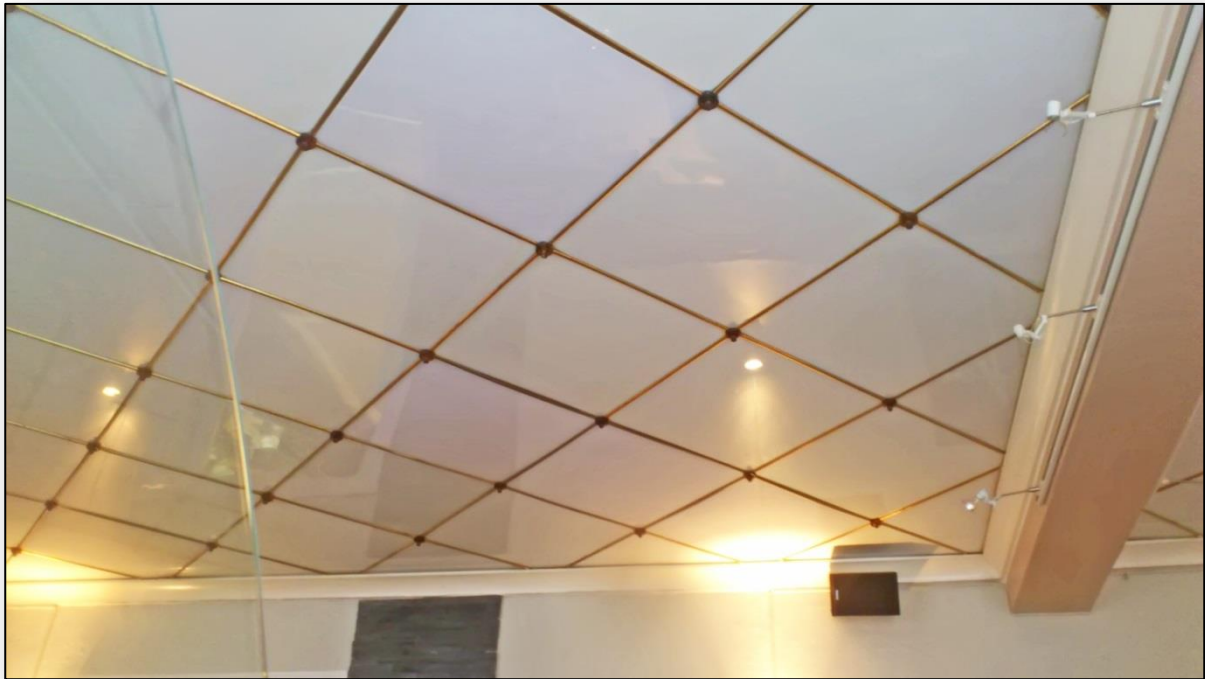
Det bevaringsværdige glasloft i ejendommen Hersegade 12 – Roskilde

Efter at far og mor solgte købmandsforretningen, har der siden været en forretning med malerier og senere igen flere restauranter og meget er lavet om, men det gamle glasloft er bevaret. Det stammer formentlig helt tilbage fra købmand Christensens butik og det kan ikke udelukkes at det er endnu ældre.