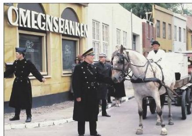
I tv-serien bliver Landbobanken til Omegnsbanken.