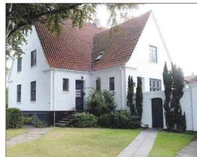
Bankdirektørens imponerende hus 'Merci', opført i 1924 på Dr. Margrethesvej 34, hvor der også var god plads til tjenestefolkene på loftet.