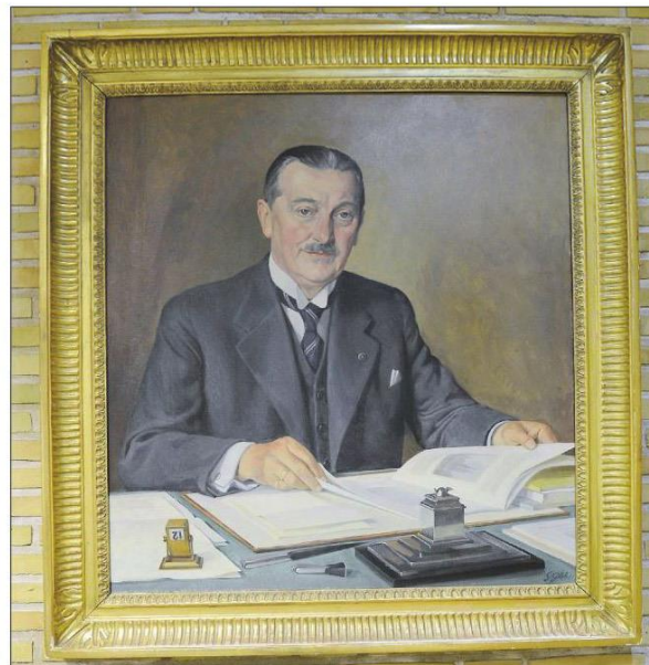
Det imponante billede af en af byens mægtigste mænd, iklædt sit stiveste puds. Maleriet er udført i 1943 af J. Glob.