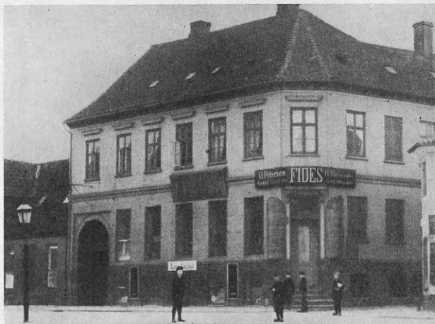
Algade Nr. 2. Omkring 1896.

De naaede deres Bestemmelsessted i god Behold, det var en By i Tyskland, og her ventede de paa deres Far. De fik god Tid til at blive forberedt til Konfirmationen, for Aar gik efter Aar, uden at han