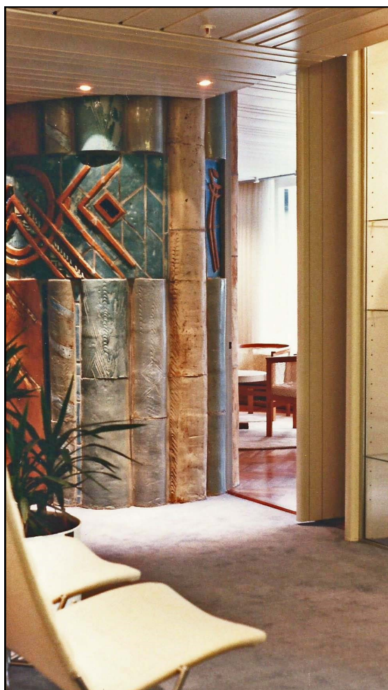
"Bagsiden" af pejsen ud mod gangarealet mellem kontorerne