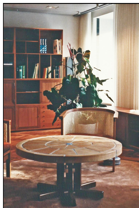
"Pejsestuen" var bl.a. indrettet med et bord med keramik-bordplade i samme materialer som pejsen