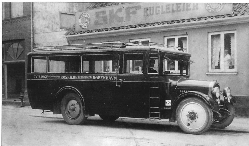
Fransk Latil rutebil fra ca. 1930, blev monteret med B&W diesel motor nr. 6 ca. 1936.

Rejsebureaubranchen mærker ligesom mange andre forretninger den voksende konkurrence, så ingen ved hvad fremtiden bringer, men Søren er fortsat altid parat til at yde den bedste service til kunderne.