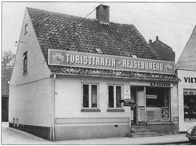
Algade 56, i 1954 blev Roskilde Rejsebureau åbnet.