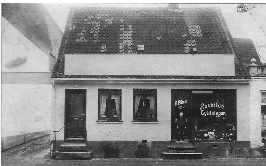
1914 firmaets første adresse i Roskilde, Algade 56, hvor Roskilde Cykellager blev åbnet.

I 1932 begyndte Statsbanerne rutebildrift og 1934 søgte DSB koncession på strækningen Hedehusene-København, samme strækning som A. P. Hansen's rute Jyllinge-Hedehusene-